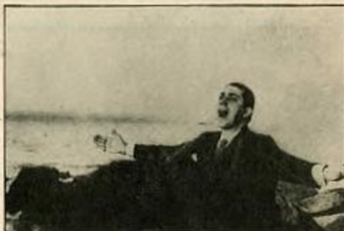
Inolvidable toma de Carlos Gardel en la playa La Mulata, por Rafael Caruso

El Archivo Caruso es la colección fotográfica de carácter privado más importante del Uruguay. Está formada por más de un millón de negativos que contienen y representan un período de setenta años de nuestra historia. En realidad, abarca más de un siglo, ya que con el paso del tiempo se fue enriqueciendo con donaciones y adquisiciones a viejos fotógrafos y antiguas instituciones. Hoy podemos decir que se trata de un verdadero banco de imágenes fotográficas, equivalente en sus características, a los más importantes del mundo.