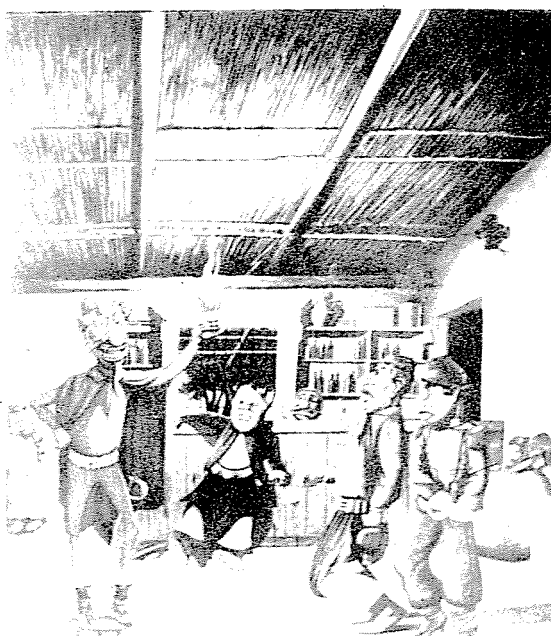
Ilustración de F. Molina Campos para el "Fausto" de Estanislao del Campo. Ed. Kraft, Buenos Aires, 1942.

La verdad, amorosamente vertida, se hace arte y el arte, humildemente aceptado como un deber moral, se hace verdad en estos pintores fieles del gaucho .