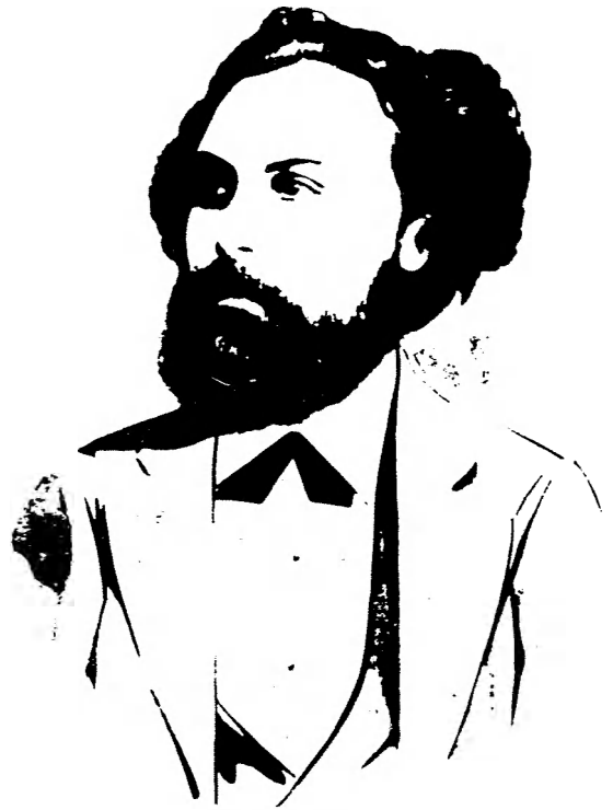
Estanislao del Campo

El relato de un suceso (acontecimiento, fiesta, pelea, representación teatral) por un gaucho, a través de su lenguaje, su sentido de los valores, su sistema especial de referencias, su sensibilidad, su humor, su gracia, es un recurso de formidable poder de entretenimiento. El propósito y el tema ya están en Hidalgo, asoman apenas en sus dos primeros diálogos y constituyen el asunto de la Relación que hace el gaucho Ramón Contreras a Jacinto Chano de todo lo que vio en las fiestas mayas de Buenos Aires en 1822 . Ascasubi, en varios de los asuntos secundarios de sus diálogos y en el asunto principal de Jacinto Amores , sigue a Hidalgo y a partir de entonces el tema es re-